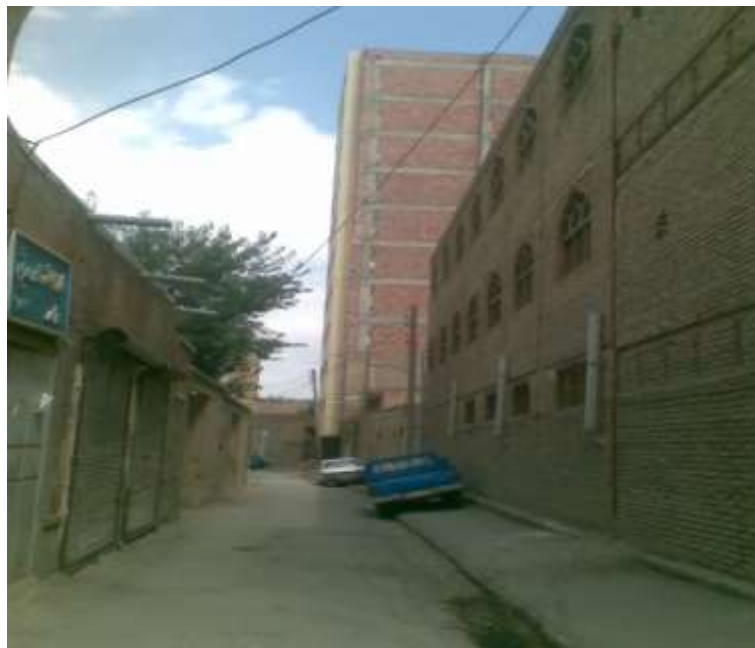
شکل ۳: تصویری از یک ساختمان بلندمرتبه و کوچه مشرف به آن

وجود ندارد و یا با پرداخت جریمه در ساخت وسازهایی با پروانه خلافی‌ها، قابل حل و فصل می‌باشد در بیشتر موارد، قوانین و ضوابط مربوط به گذراندن در این مناطق رعایت نشده است در ضمن در صورت رعایت قوانین گذراندن به دلیل بافت قدیمی کوچه‌ها و خیابان‌ها، بعضی ساختمان‌های تازه‌ساز عقب‌کشی لازم را انجام داده‌اند درحالی‌که ساختمان کناری متروکه بوده و یا هنوز با همان ساختار قدیمی استفاده می‌شود و عقب‌کشی در آن‌ها انجام نشده است. لذا رفت‌وآمد خودروها به دشواری در آن‌ها صورت می‌گیرد. شکل ۳ تصویر یکی از ساختمان‌های بلندمرتبه را از سمت کوچه کناری نشان می‌دهد. چنانچه از تصویر استنباط می‌شود کوچه مشرف به ساختمان‌ها عرض بسیار کمی دارد، با وجود اینکه هنوز از تمام واحدهای ساختمان فوق بهره‌برداری نمی‌شود ولی برای رفت‌وآمد با خودرو از کوچه‌های مجاور آن‌ها باید منتظر بازشدن مسیر شد و یا با برگشت، مسیر را برای خودروهای مقابل باز نمود.