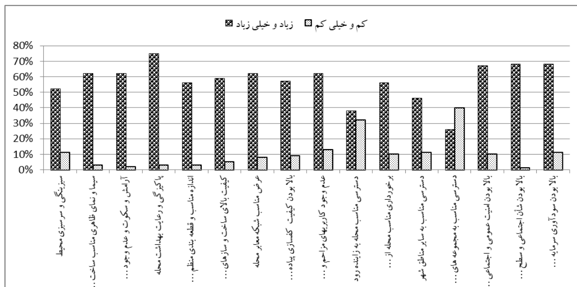
شکل ۳: تحلیل شاخص‌های کیفی تحقیق در محیط‌های مسکونی مطلوب