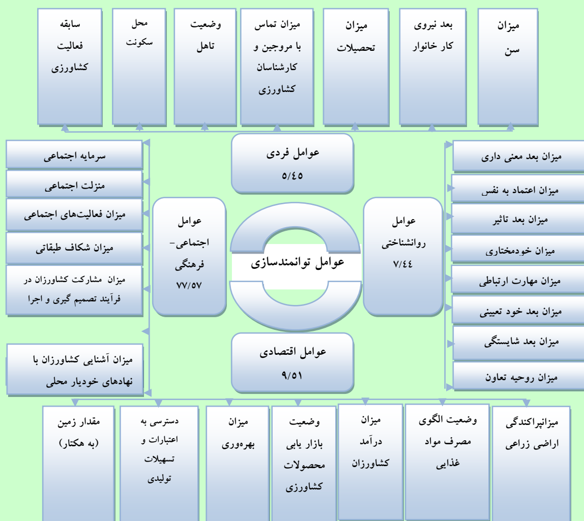
شکل شماره ۳: مدل نهایی پژوهش؛ عوامل موثر بر توانمندسازی کشاورزان و درصد تبیین هر یک از آنها

عامل دوم: متغیرهای قرار گرفته در این عامل شامل: وضعیت الگوی مصرف مواد غذایی، میزان درآمد کشاورزان، میزان پراکنش اراضی کشاورزی، میزان بهره‌وری، دسترسی به اعتبارات و تسهیلات تولیدی، وضعیت بازار یابی محصولات کشاورزی و مقدار زمین به (هکتار) کشاورزان می‌باشند. همان طور که ملاحظه می‌گردد بار عاملی این متغیرها بین ۰/۴۹ تا ۰/۸۰ متغیر است و تمامی متغیرها با عامل دوم همبستگی مثبت دارند. با توجه به ماهیت متغیرهای تشکیل دهنده، نام «عوامل اقتصادی» برای این عامل انتخاب گردید. که با مقدار ویژه (۰/۸۱)، در مجموع (۱۸/۷۵) درصد از واریانس کل را تبیین می‌کند.