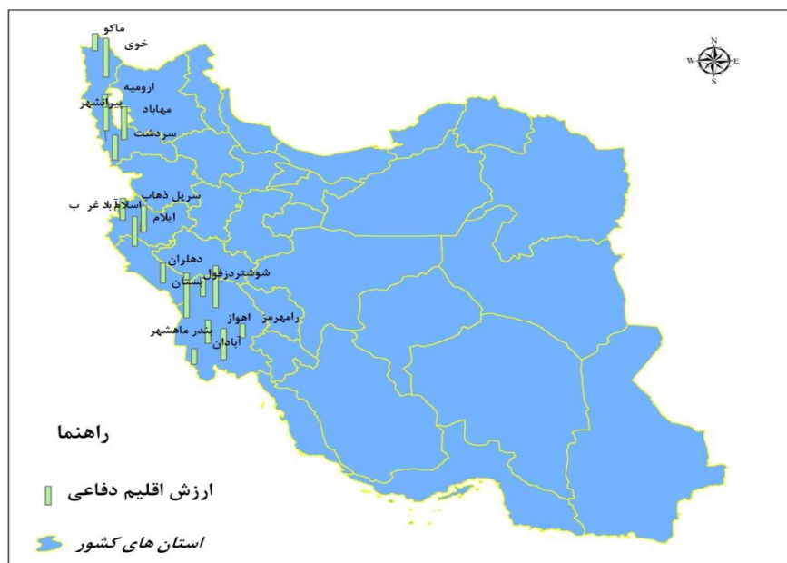
شکل ۲: ارزش اقلیم دفاعی مناطق غربی کشور ایران

بر طبق نتایج به دست آمده، در نهایت منطقه بستان، شوشتر و خوی بهترین مناطق و رامهرمز و ارومیه بدترین از لحاظ اقلیم دفاعی در پدافند غیرعامل انتخاب گردید (شکل ۲).