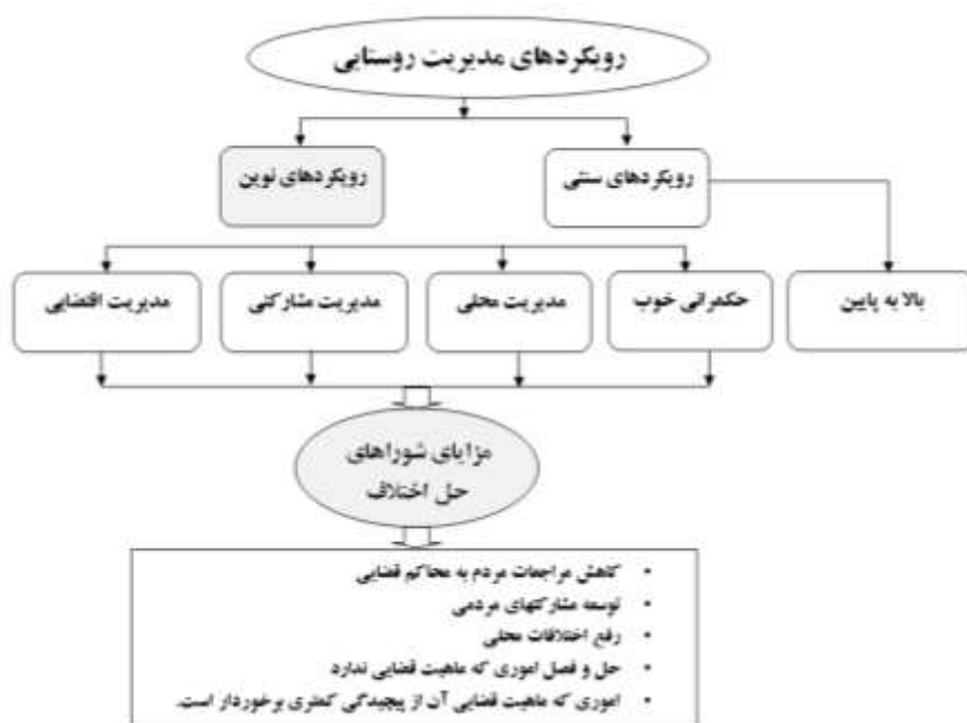
شکل ۱: شورای حل اختلاف، اهمی در راستای تحقق رویکردهای نوین مدیریت روستایی

از مزایای به‌کارگیری مدیریت محلی تاکید بر افزایش مشارکت مردم محلی می‌باشد که از زمره شاخص‌های دستیابی به حکمروایی مطلوب در فضاهای روستایی به‌شمار می‌آید که شوراهای حل اختلاف با تامین این شرایط به حضور و مشارکت مردم و همچنین استفاده از پتانسیل‌های محلی فضاها برای مدیریت و توسعه آن‌ها گام برداشته‌اند (Puglies, 2001: 14) (شکل ۱).