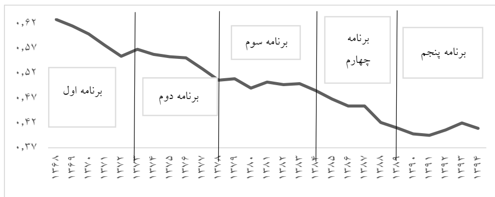
شکل ۵: روند شاخص ظرفیت سفره‌های زیرزمینی برای دوره ۱۳۶۸ تا ۱۳۹۴

در سرفصل‌های برنامه دوم توسعه اقتصادی پس از انقلاب اسلامی (۱۳۷۴-۱۳۷۸) آمده است که: به منظور اجرای سیاست‌های صرفه‌جویی و هدایت مصرف‌کنندگان آب کشاورزی به سوی بهره‌برداری مطلوب، معقول و کار از منابع آب کشور، وزارت نیرو موظف است با اتخاذ تدابیر اجرایی و اقتصادی لازم، نسبت به تحویل آب در شبکه‌های آبیاری و چاه‌های عمیق و نیمه عمیق براساس الگوی مصرف بهینه آب کشاورزی برای این گونه مصرف‌کنندگان به صورت حجمی اقدام نماید.