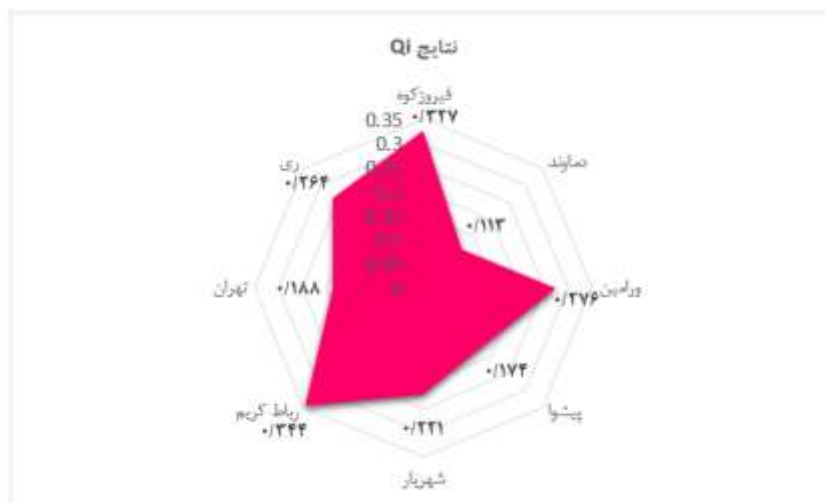
شکل ۳: رتبه‌بندی شهرستان‌های استان تهران با تأکید بر سازه‌های اصلی فرم روستایی

آتشان، حصار مهتر، قلعه بلند، و در نهایت صالح آباد شرقی قرار گرفته است. به طور کلی، وضعیت موجود فرم روستایی در شهرستان دماوند شرایط نامطلوب‌تری در مقایسه با سایر شهرستان‌های استان تهران دارد؛ سپس به ترتیب، شهرستان‌های پیشوا، تهران، شهریار، ری، ورامین، فیروزکوه، و در نهایت رباط کریم قرار گرفته‌اند (شکل ۳).