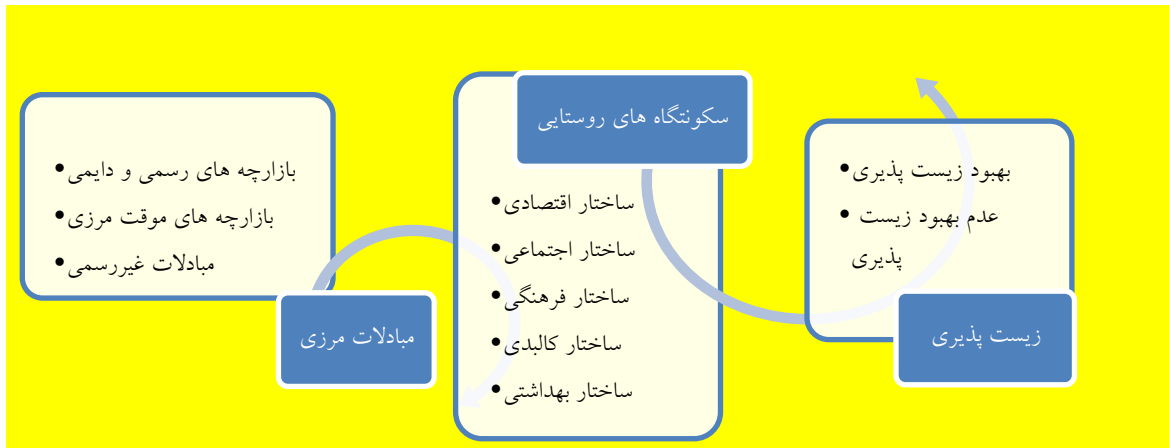
شکل ۱: مدل مفهومی پژوهش منبع: (Veisi Et Al., 2017, Tyce & Rebeca (2016), Habtamu et al (2016)