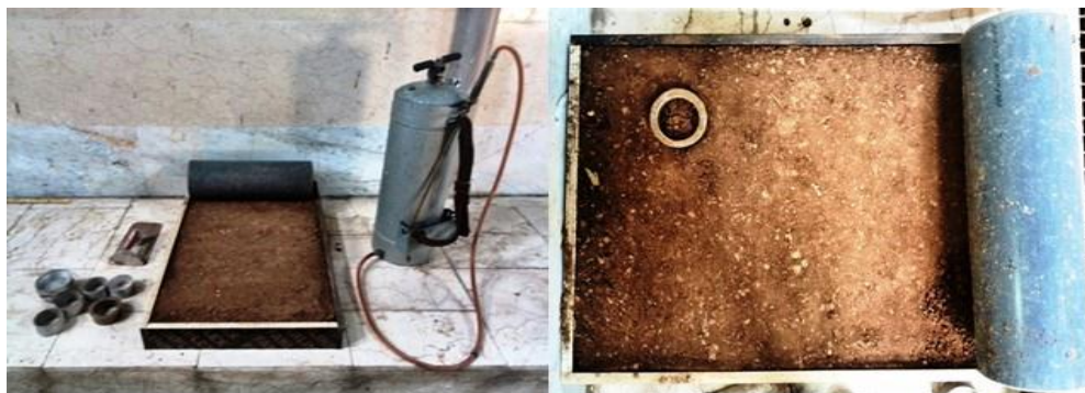
شکل ۱: شبیه‌سازی فلوم برای رسیدن به تعداد بهینه رفت‌و برگشت غلطک

خاک مورد بررسی از عمق ۰-۲۵ سانتی متری سطح خاک اراضی دیم منتخب برداشت و به محل آزمایشگاه منتقل گردید. برای آماده‌سازی خاک برای انتقال به فلوم، خاک را هوا خشک کرده تا به حد رطوبت بهینه خود برسد و سپس خاک هوا خشک شده از سرند ۱/۵ سانتی‌متری عبور داده شد. به‌منظور این‌که خاک انتقال داده شده به وزن مخصوص ظاهری خاک مورد بررسی برسد، توسط یک غلطک که یک لوله‌ی پی وی سی پر شده از سیمان است به تعداد مشخص روی خاک با حرکت رفت‌و برگشت فشرده شد. برای رسیدن به تعداد بهینه حرکت رفت‌و برگشت غلطک، به طوری که فشردگی خاک به وزن مخصوص ظاهری خاک تعیین شده در صحرا برسد، ابتدا، روی خاک در سطحی کوچک حدود ۰/۵ متر مربع اقدام به شبیه‌سازی غلطک زنی شد و در مراحل مختلف غلطک زنی نمونه برای تعیین وزن مخصوص ظاهری برداشته شد. برای خاک پیشکمر کلاله با وزن مخصوص ۱/۵ گرم بر سانتی‌متر مکعب، ۴۵ تا ۵۰ بار غلطک زدن به صورت رفت و برگشتی برای رسیدن به وزن مخصوص ظاهری مورد نظر تعیین شد. در مقابل در خاک سرارود کرمانشاه با وزن مخصوص ۱/۱ گرم بر سانتی‌متر مکعب ملاحظه شد که به تعداد خیلی کم رفت‌و برگشت غلطک در حد دو سه بار نیاز وجود دارد که آن هم برای مسطح کردن سطح رویی خاک است. وزن مخصوص خاک منطقه کوهین، ۱/۳ گرم بر سانتی‌متر مکعب محاسبه شد که این خاک به ۳۰ بار رفت و برگشت غلطک نیاز داشت تا به وزن مخصوص خود برسد. شکل (۱) شبیه‌سازی فلوم برای رسیدن به تعداد بهینه رفت‌و برگشت غلطک را نشان می‌دهد.