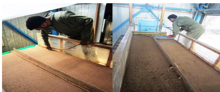
شکل ۲: آماده‌سازی خاک و فلوم در آزمایشگاه شبیه‌ساز باران و فرسایش

قبل از انجام آزمایش، بستر فلوم باید آماده شود که این آماده‌سازی شامل دو مرحله زیرسازی و روسازی فلوم است. در مرحله زیرسازی با ذرات ماسه‌ای درشت دانه یا گراول با اندازه بین ۱ تا ۲ سانتی‌متر لایه‌ای به‌عنوان زهکش به ضخامت ۵ سانتی‌متر در کف فلوم ایجاد شد. همچنین به‌منظور افزایش اصطکاک در مرز خاک و جداره فلوم، یک ریسمان کنفی در دیواره‌ی فلوم نصب شد که مانع افزایش سرعت روان آب و ایجاد شیار در مرز خاک و جداره شیشه‌ای می‌شود. در این قسمت برای در نظر گرفتن تکرار در هر آزمایش، فلوم توسط ورقه‌های فلزی به دو قسمت مساوی تقسیم شد (شکل ۲).