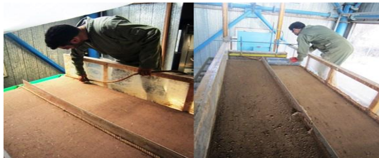
شکل ۲: آماده‌سازی خاک و فلوم در آزمایشگاه شبیه‌ساز باران و فرسایش

قبل از انجام آزمایش، بستر فلوم باید آماده شود که این آماده‌سازی شامل دو مرحله زیرسازی و روسازی فلوم است. در مرحله زیرسازی با ذرات ماسه‌ای درشت دانه یا گراول با اندازه بین ۱ تا ۲ سانتی‌متر لایه‌ای به‌عنوان زهکش به ضخامت ۵ سانتی‌متر در کف فلوم ایجاد شد. همچنین به‌منظور افزایش اصطکاک در مرز خاک و جداره فلوم، یک ریسمان کنفی در دیواره‌ی فلوم نصب شد که مانع افزایش سرعت روان آب و ایجاد شیار در مرز خاک و جداره شیشه‌ای می‌شود. در این قسمت برای در نظر گرفتن تکرار در هر آزمایش، فلوم توسط ورقه‌های فلزی به دو قسمت مساوی تقسیم شد (شکل ۲).