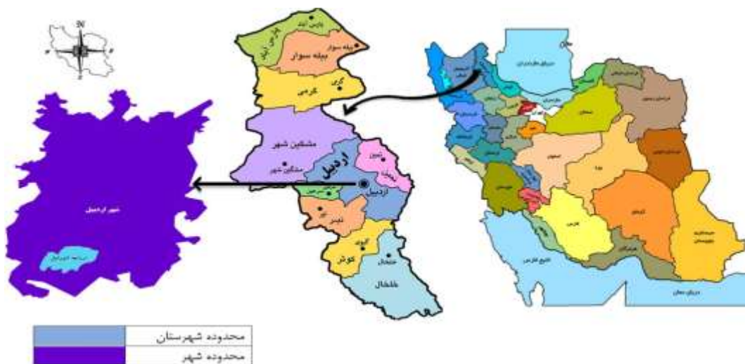
شکل ۱: موقعیت شهر اردبیل در استان و کشور Figure 1: Location of the Ardebil city in province and country

شهر اردبیل مرکز استان اردبیل در شمال غربی کشور و در موقعیت جغرافیایی ۳۸ درجه و ۱۵ دقیقه عرض شمالی و ۴۸ درجه و ۱۷ دقیقه طول شرقی واقع شده است (Statistical Center of Iran, 2017). شکل (۱) موقعیت شهر اردبیل را در سطح کشور، استان و شهرستان اردبیل نمایش می‌دهد.