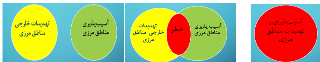
شکل ۲: ارتباط تهدیدات و آسیب‌پذیری‌ها در مناطق مرزی

با توجه به شرایط خاص و ویژه‌ای که مرزها دارند در امر آمایش سرزمین در کانون توجه سیاست‌ها قرار دارند. آمایش مناطق مرزی نوعی از برنامه‌ریزی است که ارتباط بین توسعه را با عوامل امنیتی و دفاعی در چارچوب مناطق مرزی تعریف می‌نماید. این مفهوم با همکاری مناسب جهت توسعه مناطق مرزی ارائه می‌دهد که در آن امنیت و توسعه دو مفهوم یکپارچه و در ارتباط مستقیم با هم قرار می‌گیرند و در واقع ملزوم و لازم یکدیگر هستند. بنابراین، گرچه آمایش مناطق مرزی یک نوع فن برنامه‌ریزی محسوب می‌شود، اما خود بر پایه‌های نظری و متدولوژی علمی خاصی تکیه دارد که ضمن تحلیل و تفسیر شرایط و ویژگی‌های مناطق مرزی، موانع توسعه و یا امنیت را توأمان در نظر گرفته و برای آنها راه‌حل‌های یکپارچه‌ای ارائه می‌دهد تا اهداف توسعه و امنیت در مناطق مرزی بر یکدیگر منطبق سازد. براساس این توضیحات که برای آمایش مناطق مرزی داده شد، آمایش مناطق مرزی را می‌توان نوعی برنامه‌ریزی راهبردی- فضایی در فضاهای مرزی کشورها دانست (Rezazadeh et al., 2015:52). ویژگی‌های مناطق مرزی موجب بروز آثار و پی‌آمدهای منفی برای این مناطق شده و افزایش آسیب‌پذیری‌های توسعه، امنیت و دفاع مناطق مرزی را در پی دارد. ارتباط میان تهدیدات و آسیب‌پذیری‌ها در مناطق مرزی در چند حالت محتمل به شرح ذیل قابل طرح است: