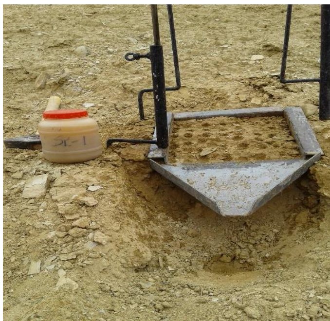
Figure 3: A simulator in the lower red gypsum marl by measuring runoff in the laboratory