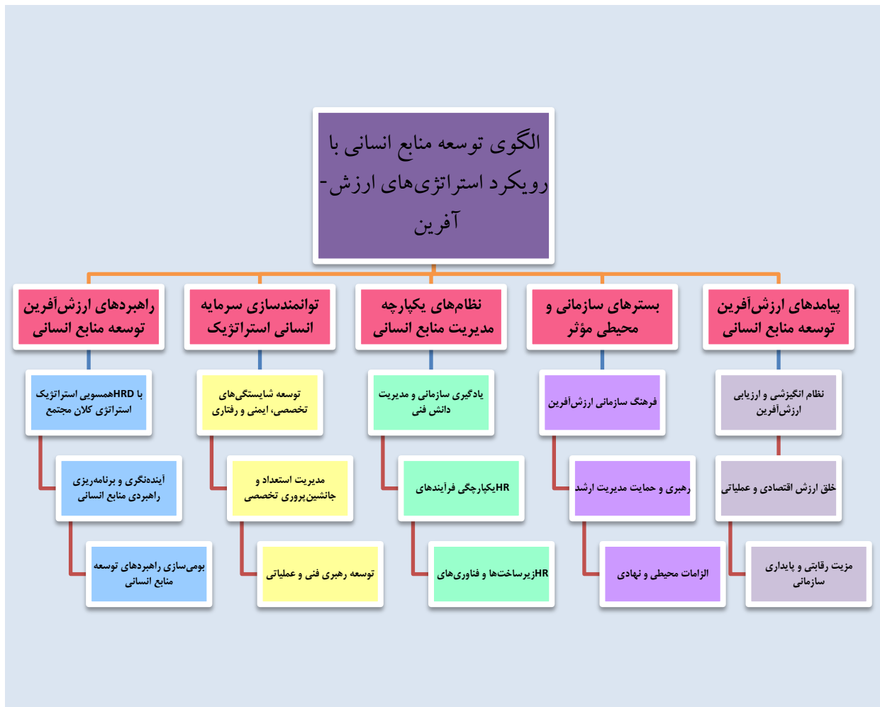
شکل ۱- الگوی توسعه منابع انسانی با رویکرد استراتژی‌های ارزش‌آفرین

در این بخش از مدل تحلیل داده‌های کیفی، پارادایم کدگذاری محوری را تدوین کردیم که بر اساس آن، خط ارتباطی میان مقوله‌های پژوهش شامل ۱- راهبردهای ارزش‌آفرین توسعه منابع انسانی، ۲- توانمندسازی سرمایه انسانی استراتژیک، ۳- نظام‌های یکپارچه مدیریت منابع انسانی، ۴- بسترهای سازمانی و محیطی مؤثر، و ۵- پیامدهای ارزش‌آفرین توسعه منابع انسانی مشخص شد. نمودار (۱) پارادایم کدگذاری محوری و به عبارت دیگر مدل فرآیند کیفی پژوهش را نشان می‌دهد. در ادامه، کدگذاری انتخابی را پی می‌ریزیم و به بررسی و شرح اجزای مدل کیفی پژوهش می‌پردازیم.