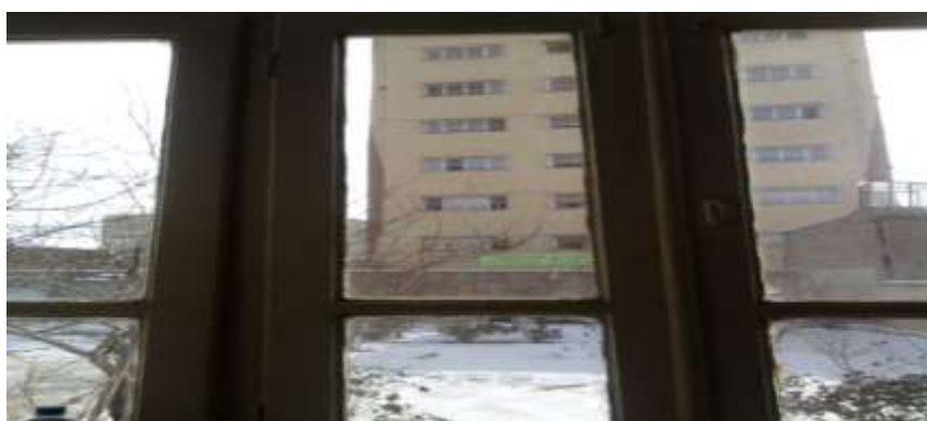
شکل ۲: تصویر ساختمان بلندمرتبه از حیاط یک خانه قدیمی

در ارتباط با آرامش روحی و روانی خانواده‌ها در مجاورت ساختمان‌های بلندمرتبه مشاهدات نشان می‌دهد که در مناطق مرکزی شهری به دلیل اینکه بافت شهر قدیمی می‌باشد اکثر خانه‌ها دارای حیاط بزرگ و پنجره‌های باز رو به حیاط می‌باشند، عادت عمومی مردم، وابستگی آن‌ها به فضای سبز حیاط خانه را نشان می‌دهد. ساخت ساختمان‌های بلندمرتبه در مجاورت محل سکونت آن‌ها، آرامش ساکنان در دسترسی به حیاط خانه و حتی آرامش داخل اتاق‌های خانه را مختل کرده است. بررسی موقعیت مکانی تعدادی از ساختمان‌های بلندمرتبه نشان می‌دهد که در آن‌ها با وجود تنگ بودن عرض کوچه‌ها و زیاد بودن تعداد طبقات ساختمان، ضوابط و معیارهای شهرسازی و معماری از جمله اشرافیت، تراکم و تفکیک طبقات، گذربندی و ایجاد پارکینگ به طور کامل رعایت نگردیده است و یا در صورت رعایت موارد فوق، به دلیل اینکه بافت شهر قدیمی می‌باشد هنوز آمادگی ساختاری، فرهنگی و اجتماعی لازم برای کنار آمدن با این موضوع در خانواده‌ها وجود ندارد. لذا همین مسائل یکی از دلایل اصلی در نارضایتی ساکنان این مناطق از احداث ساختمان‌های بلندمرتبه می‌باشد. در شکل ۲ تصویر یکی از ساختمان‌های بلندمرتبه از داخل اتاق یکی از ساختمان‌های مجاور نشان داده شده است که خود تصویر گویایی از مسائل پیش‌آمده می‌باشد.