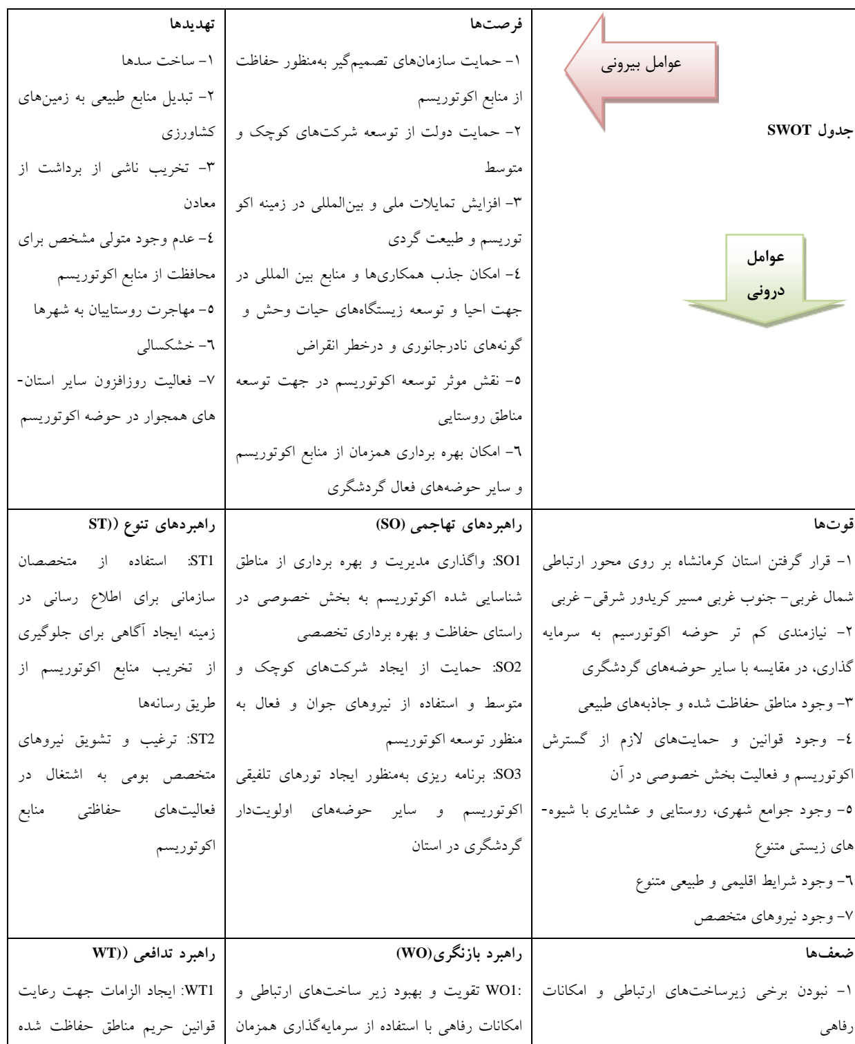
جدول ۳- ماتریس SWOT برای استخراج استراتژی های ممکن

استراتژی قوت -فرصت (SO)، ضعف-فرصت (WO)، قوت-تهدید (ST) و ضعف-تهدید (WT) در جدول (۳) قرار گرفته اند.