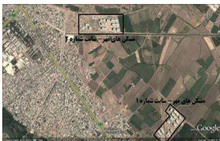
شکل ۳: قرار گرفتن مسکن‌های مهر بر روی زمین‌های حاصلخیز کشاورزی

همچنین مجتمع‌های مسکن مهر میاندوآب بر روی حاصلخیزین و بهترین خاک‌های کشاورزی از نظر زراعی مکان‌گزیده‌اند که بیانگر ناسازگاری کامل کاربری اراضی زارعی و محیط ساخته شده است. هر دو سایت مسکن مهر این شهر در داخل و در مجاورت باغات و اراضی کشاورزی احداث شده‌اند (شکل ۳) که این موضوع نه تنها موجب از بین رفتن اراضی کشاورزی و پایین آمدن راندمان تولیدی محصولات زراعی باتوجه به غالبیت فعالیت کشاورزی در این شهرستان می‌شود، بلکه در چند سال آینده تهدیدی برای زمین‌های مجاور این مجتمع‌ها محسوب می‌گردد. چرا که اینگونه اراضی که جهت الحاق به اراضی شهری و کسب سود بیش‌تر برای مدت کوتاهی بلااستفاده می‌مانند و در نهایت با رشد پراکنده شهر و قرارگرفتن در محدوده قانونی شهر به کاربری‌های شهری تغییر می‌یابند.