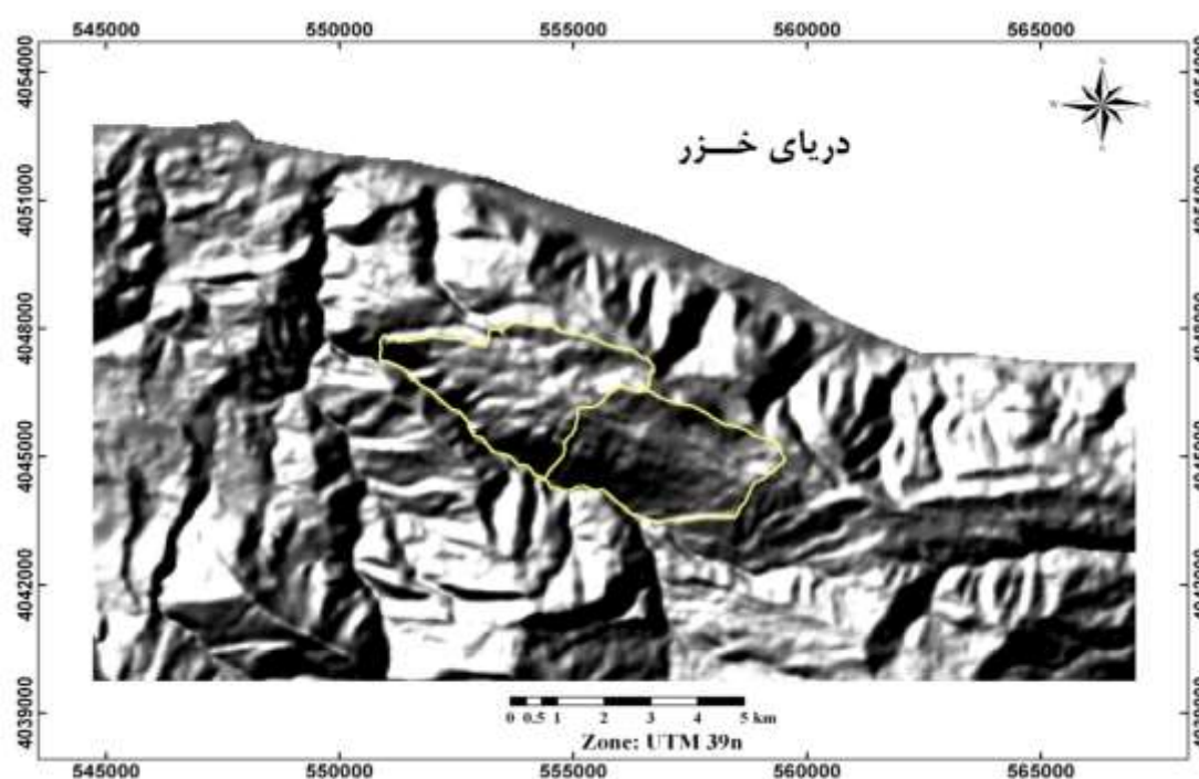
شکل ۱: موقعیت منطقه مورد مطالعه در نقشه پستی و بلندی منطقه

در این تحقیق از داده‌های سنجنده TM ماهواره لندست ۵ به شماره‌گذر ۱۶۵ و ردیف ۳۵ مربوط به تاریخ ۲۰ مرداد ماه سال ۱۳۹۰ هجری شمسی (۱۱ آگوست ۲۰۱۱ میلادی) و از نقشه‌های دو بعدی (2D) برای کنترل کیفیت هندسه تصاویر ماهواره‌ای استفاده شد. برای تجزیه و تحلیل رقومی، پردازش تصاویر ماهواره‌ای، از نرم‌افزار Idrisi Taiga برای استخراج مختصات قطعات نمونه برداشت شده از نرم‌افزار MapSource، برای طراحی و انطباق قطعات نمونه و قرائت نقشه‌ها از نرم‌افزار ArcGIS 9.3 و Arcview3.2a، برای تجزیه و تحلیل آماری داده‌ها و رسم نمودارها از نرم‌افزارهای Microsoft Excel و SPSS Ver20 استفاده شد.