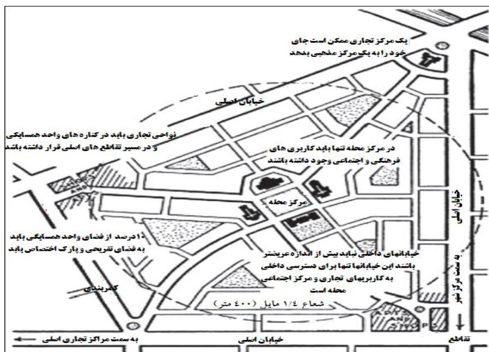
شکل ۱: طرح واحد همسایگی کلارنس پری (پینگار ۱۵ ، ۲۰۱۲)

الف) توسعه محله سنتی (TND): آندرودوانی و الیزابت پلاتر-زیبرک از پیشگامان توسعه محله سنتی یا TND هستند. واحد اصلی این رویکرد محله‌ای است که اندازه‌اش از ۴۰ تا ۲۰۰ ایکر و ساختار بندایش شعاعی با بیش از یک چهارم مایل است و به گونه‌ای طراحی شده که اکثر خانه‌هایش حداکثر سه دقیقه پیاده‌روی تا پارک‌های محله و پنج دقیقه پیاده‌روی تا میدان یا فضای مشترک مرکزی فاصله دارد (مدنی‌پور، ۱۳۸۷: ۳۱۲). از نظر دوانی و پلاتر-زیبرک اصول استخراجی از اندازه و سازمان فضایی پیشینیان برای یک محله عبارتند از ۱- محله باید دارای مرکز و لبه باشد، ۲- اندازه بهینه محله یک چهارم مایل از مرکز به لبه باشد، ۳- محله ترکیبی متعادل از فعالیت‌ها، سکونت، خرید، کار، تحصیل (آموزش)، عبادت و تفریح دارد. ۴- محله مکان ساختمان‌ها و ترافیک را بر روی یک شبکه خوب از خیابان‌های پیوسته سازماندهی می‌کند. ۵- محله اولویت را به فضای عمومی و جای‌گیری مناسب ساختمان‌های شهری می‌دهد (کنگره نوشهرگرایی ۱۶ ، ۱۹۹۶: ۸۱).