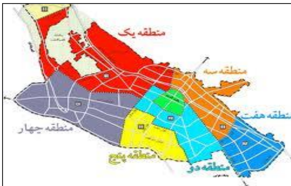
شکل ۳: محدوده مناطق مورد مطالعه شهر شیراز