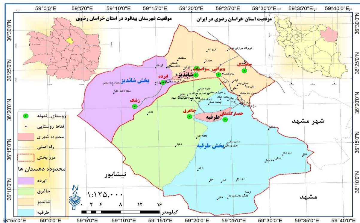
شکل ۲: موقعیت منطقه‌ی مورد مطالعه