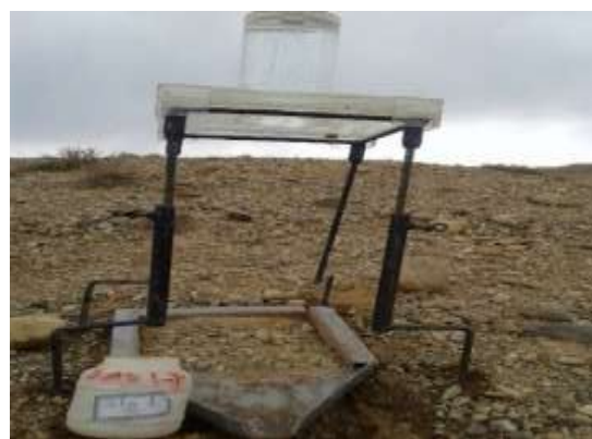
شکل ۲: دستگاه شبیه‌ساز باران در واحدهای کاری غیر مارنی (راست) و مارنی (چپ)