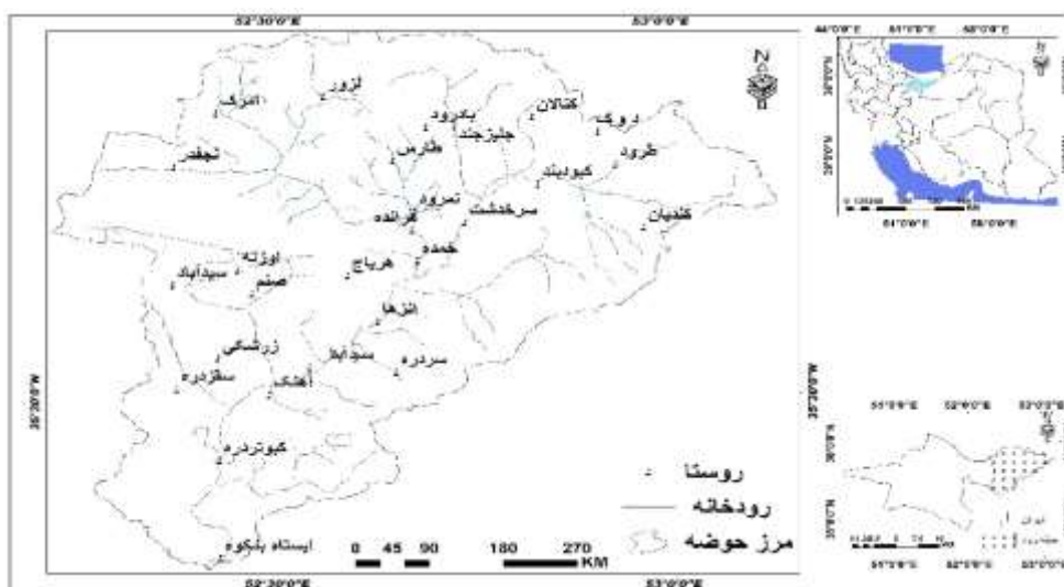
شکل ۱: نقشه موقعیت جغرافیایی منطقه تحقیق و حوضه حبله رود

بلندترین نقطه ارتفاعی این حوضه ۴۰۰۳ متر و حداقل ارتفاعی آن ۱۰۰۰ متر از سطح دریا است. واحدهای زمین‌شناسی این حوضه در محدوده زمانی پرکامبرین تا کواترنری قرار دارند و مربوط به سازندهای کهر، بایندر، زایگون، لالون، مبارک، الیکا، شمشک، دلیچای، لار، تیزکوه، فاجان، زیارت، کرج، کند، قرمز تحتانی، قم، قرمز فوقانی، کهریزک، آبرفت تهران و سنگ‌های ولکانیکی دوره چهارم می‌باشد. سنگ‌شناسی غالب شامل آهک، مارن، شیل و ماسه‌سنگ، توف و آبرفت است.