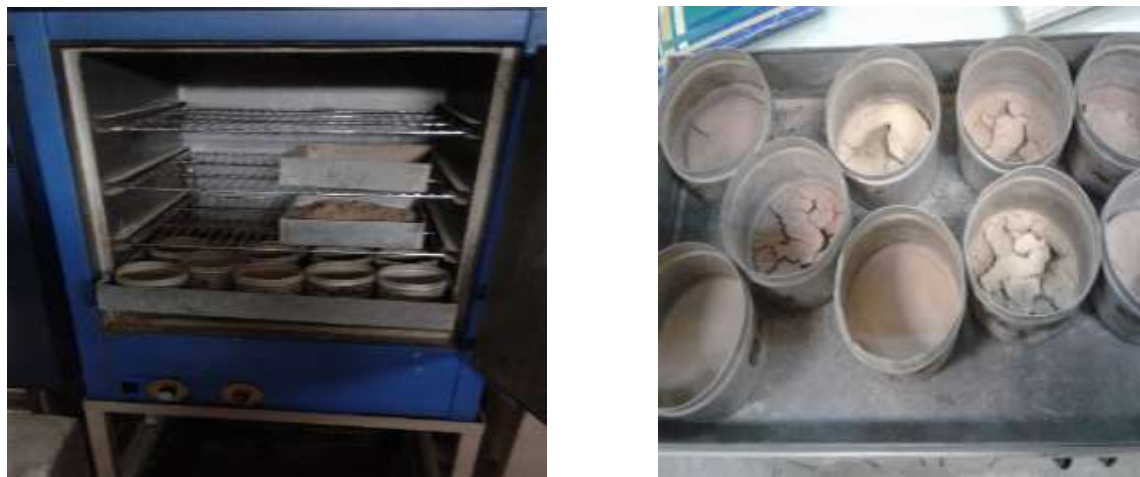
شکل ۳: خشک نمودن و توزین رسوب نمونه‌ها در آزمایشگاه

با تعمیم نتایج باران‌ساز (شکل ۳) از سطح دامنه‌ها به سطح زیرحوضه‌ها نشان داد که حداکثر رسوب ویژه ۴/۳ تن در هکتار و متوسط ۱/۶۷ تن در هکتار برای کل حوضه در اثر یک واقعه بارش می‌باشد (شکل ۴).