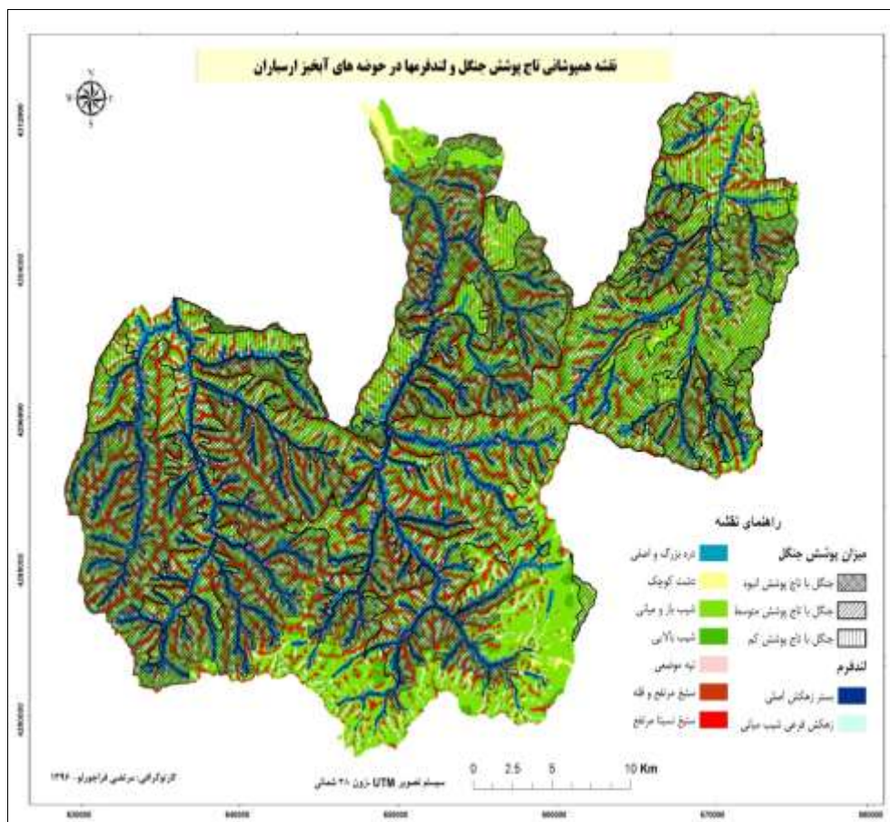
شکل ۲: نقشه همپوشانی طبقات تراکم جنگل با طبقات لندفرمی در حوضه‌های آبخیز ارسباران

رابطه منفی پارامتر ارتفاع با فراوانی پوشش گیاهی را در حوضه‌های آبخیز مورد مطالعه می‌توان به عوامل مختلفی نسبت داد: اول این‌که خاک‌های مرتفعات عمدتاً خاک‌های کم‌عمق با سنگ بستر نزدیک به سطح زمین هستند که به‌شدت ظرفیت کل نگهداشت آب را محدود می‌سازند (Iverson et al, 1997: 337). دوم این‌که ممکن است با افزایش ارتفاع به دلیل گسترش جمعیت روستایی و عشایری، با تخریب بیش‌تری مواجه شویم (Mirzaeizadeh & Niknejad, 2013: 102). سوم و شاید مهم‌تر از همه این‌که فرم‌اسیون گیاهی غالب منطقه، جنگل بوده و جنگل‌های خوب عمدتاً در ارتفاعات میانی واقع شده‌اند. در همین راستا نتایج هم‌پوشانی طبقات تاج پوشش جنگلی با طبقات لندفرم‌ها (شکل ۲) نیز نشانگر این بود که قسمت عمده جنگل‌ها مربوط به شیب‌های باز ارتفاعات میانی هستند. نقشه مربوط نشان داد که حدود ۴۰ درصد جنگل‌های انبوه، ۶۶ درصد جنگل‌های نیمه‌انبوه و ۵۰ درصد جنگل‌های تنک در طبقه لندفرمی شیب باز میانی واقع شده‌اند. به هر صورت نتیجه حاصل در مغایرت با نتایج محققانی چون Deng et al (2007)، Zaremehrijardi et al (2007)، Taghipour & Rastgar (2010) بوده و در مقابل با نتایج (Ghorbanli et al (2015)؛ Spadavecchia et al (2008) مطابقت دارد.