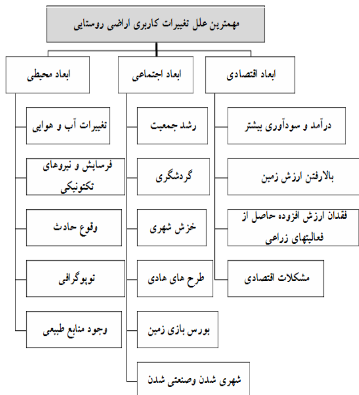
شکل ۱: مهم‌ترین عوامل تغییر کاربری اراضی روستایی

تغییرات تکنولوژیک، توسعه حمل و نقل، ظهور سیستم‌های دولتی، سیاست‌گذاری و بروز تفکرات مصرف‌گرایی موجب پیدایش انواع مختلف گردشگری و تفریح شده است که این امر منجر به بروز تغییرات کاربری اراضی می‌شود (Motiee Langeroodi et al., 2012). در کشورهای در حال توسعه، بورس‌بازی زمین مهم‌ترین عامل تغییرات اراضی کشاورزی می‌باشد که تحت تاثیر عوامل بیرونی مانند تصمیمات سیاسی، تغییر در استانداردهای زندگی، تغییر در فناوری، تاثیرات نیروهای بازار و فشار توسعه شهر بوده است (Zia Tavana & Amir Entkhabi, 2008). در کشورهای صنعتی سیاست‌های حمایتی از بخش کشاورزی با اعطاء یارانه‌ها و بستن بازارهای داخلی در مقابل واردات اعمال می‌شود که مانع تغییر کاربری اراضی است. همچنین دو پدیده خوردنگی و خزش شهری نیز عوامل تعیین‌کننده‌ای هستند که با دست‌اندازی کانون‌های شهری به اراضی کشاورزی و روستایی پیرامونی در ارتباط تنگاتنگ قرار دارد. لذا نفوذ کاربری‌های شهری به فضاهای باز روستایی، اغلب فضاهای باز را به‌طور بالقوه برای تولید مسکن و کاربردهای جانبی قابل توسعه ساخت؛ بنابراین ارزش فروش زمین به‌منظور کاربری‌های مزبور از ارزش زمین به‌منظور کاربری‌های سنتی بیشتر شد (Afrakhteh, 2008). بر این اساس می‌توان عوامل موثر بر تغییر کاربری اراضی را به‌طور عام و صرف‌نظر از موقعیت منطقه‌ای خاص در ابعاد مختلف اقتصادی، محیطی و اجتماعی دسته‌بندی کرد (شکل ۱).