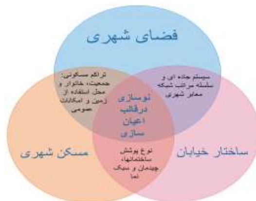
شکل ۱: مولفه‌های تبیین نوسازی بافت قدیمی در قالب اعیان‌سازی

اگرچه اعیان‌سازی عمدتاً به دیدی منفی نگریسته شده و همواره به سبب تبعات اجتماعی ناشی از آن مورد نقد قرار می‌گیرد، با این وجود در بسیاری از شهرهای جهان به‌عنوان روشی زود بازده برای مداخله در بافت‌های فرسوده و مسأله دار توسط متصدیان و مسئولان مورد استفاده قرار گرفته است (Sheikhi and Nouri Kia, 2017: 4). علاوه بر اثرات مثبت و گسترده کالبدی-فضایی، کاهش جرم‌وجنایت، افزایش سرمایه‌گذاری در ساخت‌وسازهای جدید و زیرساخت‌های شهری و ارتقای فعالیت‌های اقتصادی در محلات اهدافی هستند که اتخاذ این روش را توجیه‌پذیر و حتی در مواردی اجتناب‌ناپذیر جلوه می‌دهند. ورود سرمایه‌گذاری‌ها، زمینه‌های مالیاتی جدید و رونق بازارهای محلی، ارتقای خدمات، افزایش زیبایی محله و حذف مشاغل و عوامل ایجادکننده آلودگی‌های صوتی و بصری از معمول‌ترین موارد مورد تقاضای ساکنان تازه وارد است (Bernt, 2012: 56). بررسی پژوهشگران بر این باورند که بررسی نوسازی بافت قدیمی و نامنظم شهری به سبک اعیان‌سازی براساس سه مولفه ارزیابی می‌گردد؛ فضای شهری، ساختار خیابان و مسکن شهری (Ju ET AL, 2009: 240)؛ یعنی به‌واسطه نوع تغییراتی که در این سه مولفه ایجاد می‌شود، می‌توان وضعیت اعیان‌سازی در بافت را تبیین نمود.