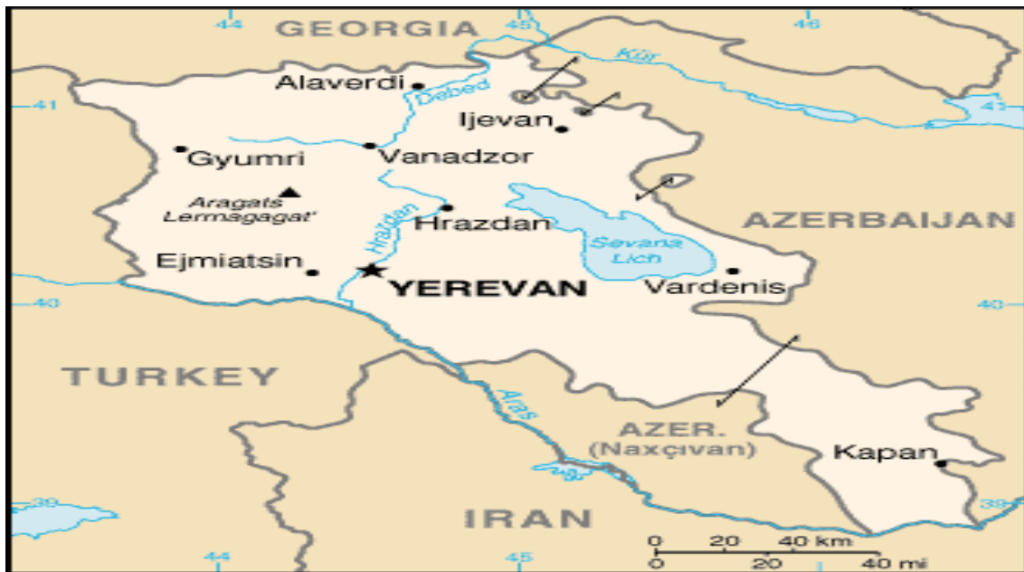
نقشه شماره ۵- کشور ارمنستان