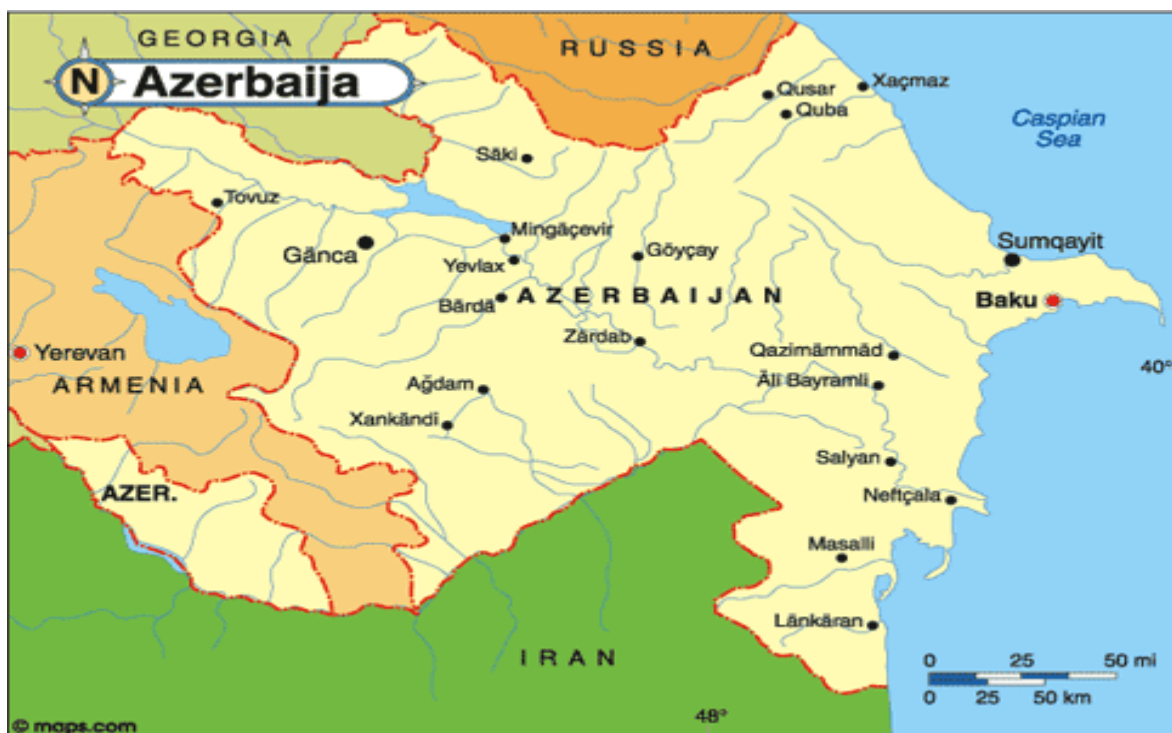
نقشه شماره ۴- کشور آذربایجان