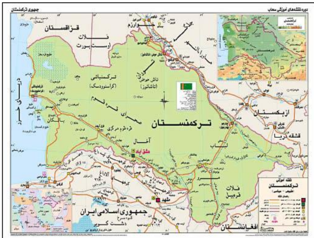
نقشه شماره ۶- کشور ترکمنستان