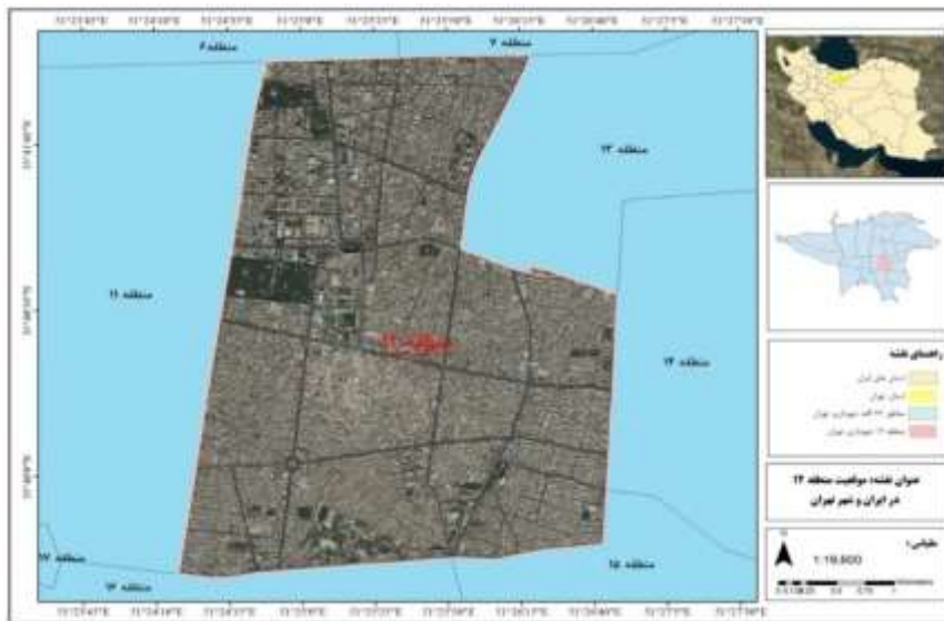
شکل ۲: نقشه موقعیت منطقه ۱۲ شهر تهران.

منطقه ۱۲ تهران با جمعیت ۲۴۱۸۳۱ نفر، ۳/۱۷ درصد از کل جمعیت تهران را به خود اختصاص داده است (شکل ۲). این منطقه با وسعت ۱۶۰۱/۷ هکتار، ۲/۳۰ درصد مساحت کل تهران را دارا است و یکی از قدیمی‌ترین مناطق تهران است که در بین مناطق ۲۲ گانه تهران دارای بیش‌ترین میزان بافت‌های ناکارآمد است. این منطقه از نظر تراکم جمعیتی در رتبه دوم مناطق شهر تهران قرار دارد و شامل ۶ ناحیه و ۱۳ محله است (Iran Statistics Center, 2016).