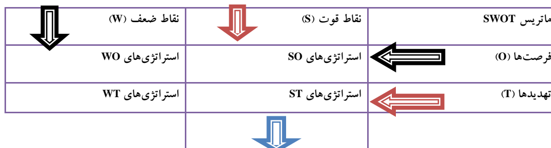
شکل ۳: ماتریس استراتژی Swot (Yagfuri et al., 2011: 5)

مدل SWOT مجموعه عوامل داخلی و خارجی موثر شناسایی و به صورت لیستی از مجموعه نقاط قوت ۱۰ و ضعف ۱۱ ، فرصت‌ها ۱۲ و تهدیدات ۱۳ تهیه شده و سپس برای وزن‌دهی و امتیازگذاری عوامل از متد سلسله مراتبی AHP استفاده شده است. وزن‌ها بر اساس روابط ریاضی از مجموعه دوبه‌دویی عوامل به دست آمد و سپس امتیاز وزنی هر معیار محاسبه شد و در نهایت با استفاده از مدل SWOT به ارائه راهبردهای استراتژی جهت توسعه فعالیت‌های بوم‌گردی در منطقه پرداخته شده است. مدل تحلیل سلسله مراتبی، ابزاری است که به طور گسترده در تصمیم‌گیری چند معیاره استفاده شده و نخستین بار توسط ساعتی ۱۴ مطرح شده است (Saaty, 1980: 32). این روش که به سرعت جای خود را در علوم مختلف باز نمود، یکی از بهترین و دقیق‌ترین روش‌های رتبه‌بندی و تصمیم‌گیری بر اساس چندین شاخص می‌باشد. از سوی دیگر این روش به گونه‌ای طراحی شده است که به وسیله آن می‌توان مسائل بزرگ و پیچیده را به مسائل کوچک‌تر تقسیم کرد و امکان ساده‌تر کردن مسئله را فراهم آورد (Akbari and Mohammad Zahedi, 2008: 194). رویکرد مدل استراتژی این است که راهبرد اثربخش باید قوت‌ها و فرصت‌های سیستم را به حداکثر، ضعف‌ها و تهدیدها را به حداقل برساند. این منطق اگر درست به کار گرفته شود نتایج بسیار خوبی برای انتخاب و طراحی یک راهبرد اثربخش خواهد داشت (Taghizadeh et al., 2011: 244). برنامه‌های راهبردی یکی از راه‌های مهم حمایتی برای تصمیم‌گیری و استفاده‌های مشترک در تحلیل عوامل داخلی و خارجی محیط به شمار می‌آید که با تعریف نقاط ضعف، قوت، فرصت‌ها و تهدیدهای سیستم می‌تواند راهبردهایی بسازد (Yuksel & Dagdviren, 2007: 365).