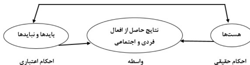
شکل ۲: نسبت میان احکام و گزاره‌های حقیقی و اعتباری (Kamran & Vasegh, 2006:80).

با توجه به مثال‌ها و گزاره‌های ذکر شده و با کمک استدلالی که در خصوص تحویل و تبدیل گزاره‌های وصفی به انشایی و بالعکس مطرح نمودیم، می‌توانیم تصویری کاملاً علمی از علم جغرافیا به‌طور اعم و جغرافیای سیاسی به‌طور خاص؛ بدست دهیم. چرا که گزاره‌های تجویزی جغرافیایی، جزء گزاره‌های اعتباری محض نیستند که با توجه به شخص اعتبارکننده، متغیر و نسبی باشند بلکه از نوع گزاره‌های تجویزی یا اعتباریاتی عقلی است که ناشی از رابطهٔ علی بین دو طرف قضیه است لذا این گزاره‌ها کاملاً گزاره‌هایی علمی بوده و قابلیت صدق و کذب دارند و به تعبیر دیگر، نسبی نیستند. می‌توان چنین نتیجه گرفت که بسیاری از احکام اعتباری و باید و نبایدهای اخلاقی، حقوقی، دینی، سیاسی، اقتصادی و نظایر آن‌ها مبتنی بر مصالح و مفاسد و آثار واقعی اعمال و افعال بوده و نوعی ضرورت قطعی و واقعی میان اعمال و نتایج مترتب بدان‌ها وجود دارد و قواعد اخلاقی و اعتباری در حقیقت صرفاً به معنای جعل ضرورت‌ها و باید و نبایدها نیست بلکه معادل کشف ضرورت و روابط حقیقی میان افعال با نتایج آن‌هاست. بنابراین جملات انشایی در اخلاق، حقوق و «سیاست» حاکی از رابطهٔ بایدها با هست‌ها نیست بلکه رابطهٔ «هست‌ها و هست‌ها» و رابطهٔ بین «اخبار با اخبار» است. بدین ترتیب ما با واسطه قرار دادن نتیجهٔ افعال که «واقعیتی بیرونی» میان فعل و فاعل است ضرورت انجام فعل از سوی فاعل را نتیجه می‌گیریم و این ضرورت، معنایی «عقلی و حقیقی» یافته و از چارچوب انشایی، مجازی، جعلی و ذوقی خارج می‌گردد (Kamran & Vasegh, 2006:80-81). این مطلب را می‌توان به شکل نمودار زیر نشان داد: