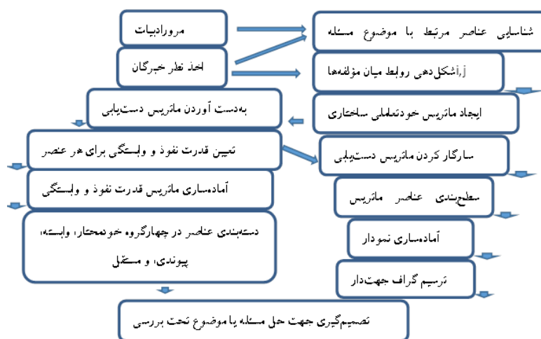
شکل ۱: مراحل اجرایی مدل‌سازی ساختاری-تفسیری

برای تعیین روابط و سطح‌بندی معیارها در مدل‌ساختاری-تفسیری ISM باید مجموعه خروجی‌ها و مجموعه ورودی‌ها برای هر معیار از ماتریس دریافتی استخراج شود. بدین منظور برای کسب اجماع نظر صاحب نظران در رابطه با موضوع حکمرانی خوب آب اقدام به مصاحبه حضوری جهت توضیح راجع به فرآیند تحقیق و نیز ابعاد موضوع مورد مطالعه شد و نیز در خصوص نحوه مقایسه بین مولفه‌ها در داخل پرسشنامه ماتریس گونه مطالب لازم به پاسخگویان عرضه شده و در نهایت با سوال از افراد پاسخگو نسبت به تعیین رجحان هر مولفه نظر نهایی آنها اخذ و در پرسشنامه درج گردید که در ادامه مجموعه دست‌یابی (اثرگذاری یا خروجی‌ها): شامل خود معیار و معیارهایی است که از آن تاثیر می‌پذیرد. مجموعه پیش‌نیاز (اثرپذیری یا ورودی‌ها): شامل خود معیار و معیارهایی است که بر آن تاثیر می‌گذارند. پس از تعیین مجموعه دست‌یابی و مجموعه پیش‌نیاز، اشتراک دو مجموعه حساب می‌شود. اولین مؤلفه‌ای که اشتراک دو مجموعه برابر با مجموعه قابل دست‌یابی (خروجی‌ها) باشد، سطح اول خواهد بود. بنابراین عناصر سطح اول بیش‌ترین تاثیرپذیری را در مدل خواهند داشت. پس از شناسایی شاخص‌های سطح اول، این عناصر حذف شده و فرآیند محاسبه مجموعه دست‌یابی و پیش‌نیاز ادامه پیدا می‌کند. این فرآیند تا حذف تمامی شاخص‌ها ادامه پیدا می‌کند.