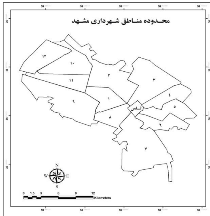
شکل ۱: نقشه مناطق شهر مشهد

شهر مشهد با مساحت ۲۰۴ کیلومتر مربع و جمعیت ۲/۵ میلیون نفر به‌عنوان بزرگ‌ترین شهر استان خراسان رضوی و یکی از مهم‌ترین شهرهای ایران مطرح است. ساخت اصلی شهر فعلی در ۲۵ سال اول قرن حاضر پایه‌ریزی شده است. خیابان، میدان و ساختمان‌های دولتی سه عامل هدایت توسعه شهر را به عهده داشته‌اند. شهر دارای دو مرکز اصلی است. چهار سمت شهر از طریق چند خیابان اصلی به میدان مرکزی اتصال می‌یابد. از سال ۴۵ به بعد توسعه شهر منطبق با طرح جامع هدایت شده است. مراکز تجاری و خدماتی در اطراف حرم و قطاع غربی تمرکز یافته‌اند و واحدهای مسکونی در دو محور غرب و شرق قرار دارند (معاونت معماری و شهرسازی مشهد، ۱۳۹۱). محدوده مورد بررسی، مناطق ۱۳ گانه شهر مشهد می‌باشد (شکل ۱).