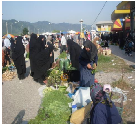
بازار دوره ای محلی