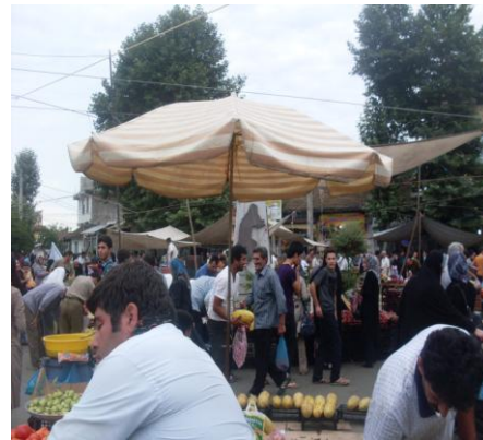
بازار دوره ای محلی پره

تصویر ۱- نمایی از دو بازار دوره ای محلی در گیلان